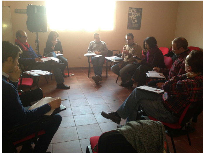
Comisión de Seguimiento Territorial La Siberia Talarrubias, 26 de febrero de 2015